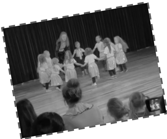
De kinderen van de Onderbouw lieten de Sprookjesdans zien en de kinderen van de Bovenbouw hun stokkendans!