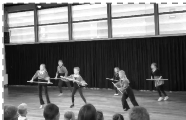
Aan het eind van onze vorige danscursus hebben we in prachtige kleren opgetreden voor de vaders en moeders en opa's en oma's!